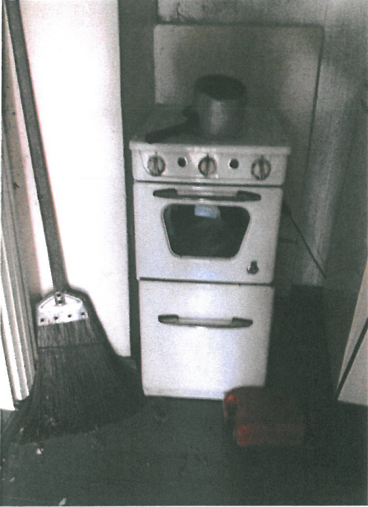
Puuhellan paikalla on laitettu sähköliesi